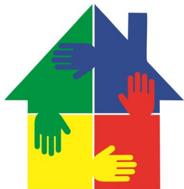
ВОООИ «ОБЪЕДИНЕНИЕ БОЛЬНЫХ САХАРНЫМ ДИАБЕТОМ»