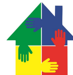
ВОООИ «ОБЪЕДИНЕНИЕ БОЛЬНЫХ САХАРНЫМ ДИАБЕТОМ»