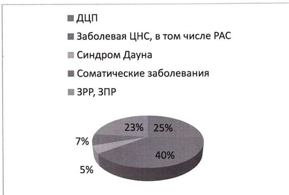
СТАТИСТИКА ПО ЗАБОЛЕВАНИЯМ (диаграмма №1)

Однако, с помощью комплексной социальной реабилитации, социально-педагогических и социально-психологических средств, особенно на ранних этапах развития ребенка, можно предупредить или ослабить ограничения, заложить основы развития устойчивой личности, способной к успешной интеграции в общество.